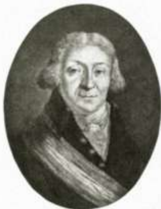
Pierre Maurice Glayre (1743-1819)

Ryt ten składał się – jak wspomniano – z 7 stopni, kolejno: Uczeń, Czeladnik, Mistrz, Kawaler Wybrany, Kawaler Szkocki, Kawaler Wschodu, a na szczycie Kawaler Różanego Krzyża. Wyższe stopnie te – co należy podkreślić – nie miały nigdy, jak we Francji, charakteru tzw. Porządków grupujących liczne podstopnie. Od strony doktrynalnej interpretacja obrządku Glayre'a wykraczała niejako poza kwestie filozoficzno-moralne, odnosząc się także do koncepcji odrodzenia (generacji) i dwóch aspektów natury, właściwej wielu starym rytom masońskim z XVIII w. Wyższe stopnie nie przynosiły jednakże nowej wiedzy ani też nie nakładały nowych obowiązków. Polscy wolnomularze traktowali je natomiast jako środki do wewnętrznego doskonalenia siebie w prawości charakteru, w poczuciu honoru, w wyrozumiałości dla drugich oraz w tolerancji dla innych światopoglądów i w dobroczynności. Ciekawostką jest też fakt, że w systemie Wielkiego Wschodu Narodowego istniała również organizacja, która